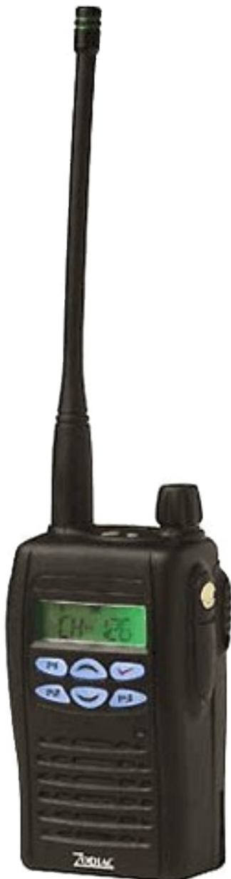
Zodiac Proline 100W

Radiotéléphone pour l'appel d'urgence REGA